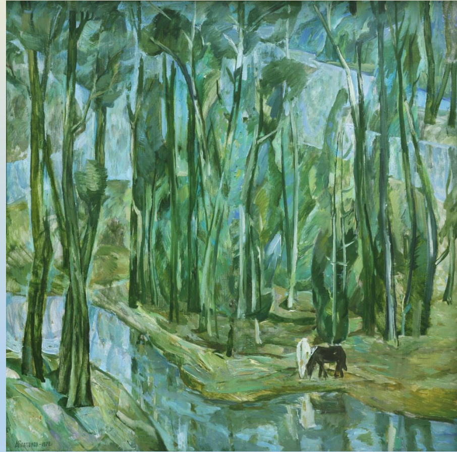
Рис. 1.2 А.Платонов «Повінь»